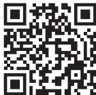
Spraakbesturing van derden